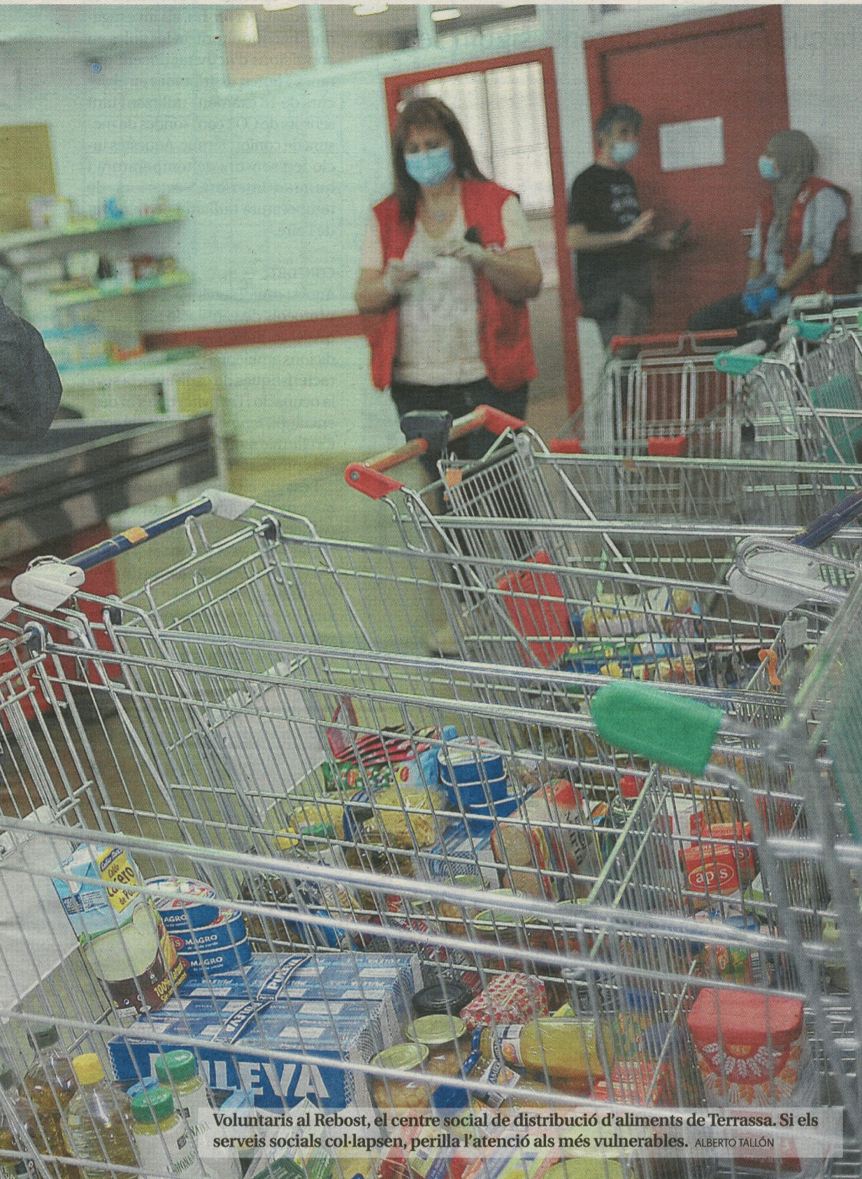
Voluntaris al Rebot, el centre social de distribució d'aliments de Terrassa. Si els serveis socials col·lapsen, perilla l'atenció als més vulnerables.

desocupació, la Renda Garantida de Ciutadania i l'Ingrés Mínim Vital, "provocant greus disfuncions, especialment entre els col·lectius en situació de vulnerabilitat", apunta l'informe.