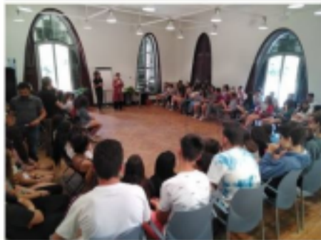
LA SÍNDICA CONVERSA AMB ESCOLARS A LA MASIA FREIXA.