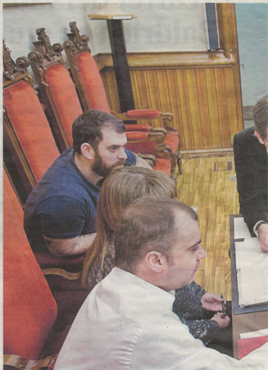
Improvisada reunió del govern a l'inici del ple.